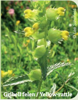
Gribell felen / Yellow-rattle

Eithinog is a diverse meadow and woodland area rich in wildlife. It was traditionally farmed for centuries which encouraged the growth of wildflowers and fungi.