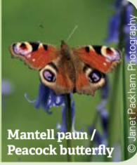
Mantell paun / Peacock butterfly

Spot a variety of butterflies. You can see red admirals , speckled wood and peacock from spring to summer.