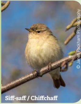
Siff-saff / Chiffchaff

Look for robins and warblers . Listen for the call of chiffchaffs which sounds as its name. Flocks of redwing can be seen at the site over winter.