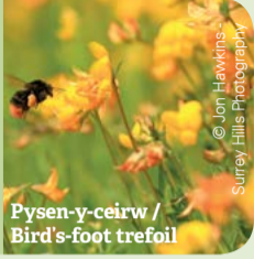
Pysen-y-ceirw / Bird's-foot trefoil

Enjoy wildflowers such as bird's-foot trefoil , yellow-rattle and lady's-smock . These can be seen in summer.