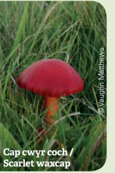
Cap cwyr coch / Scarlet waxcap

Notice the growth of colourful fungi. Eithinog is home to species such as the shiny red scarlet waxcap , green parrot waxcap and yellow coral fungi . These can be seen in summer and winter.