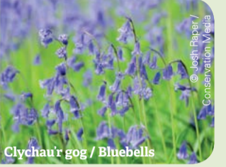
Clychau'r gog / Bluebells

See the bright bluebells which are plentiful in the woods in springtime.